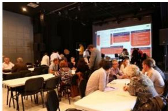
(Atelier PAT-photos site CASA)