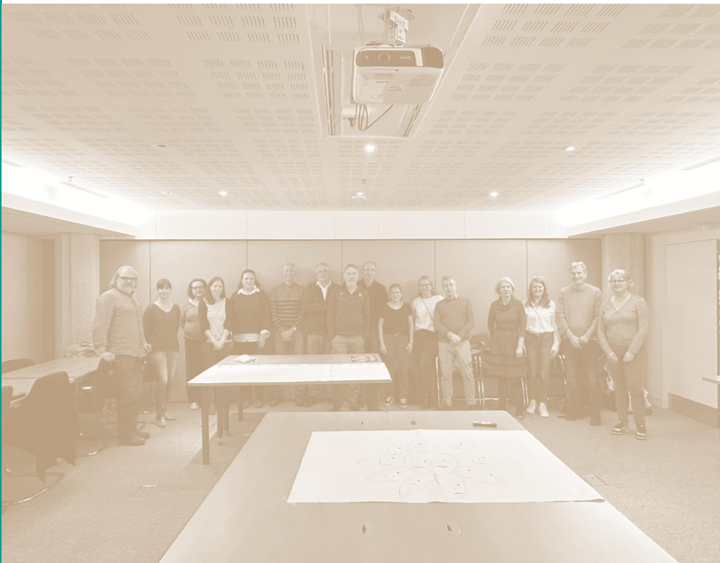
Fresque alimentaire 16/04/2025