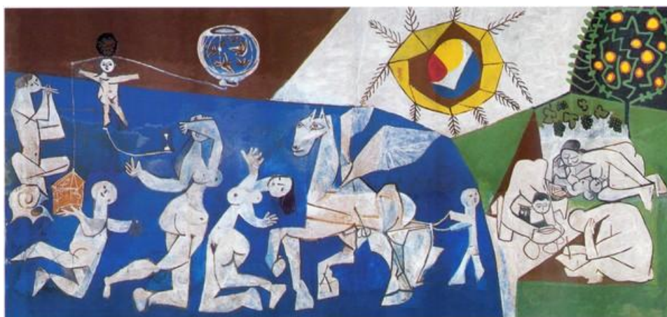
Pablo Picasso, La Guerre et la Paix , 1952 Picasso administration Paris 2025